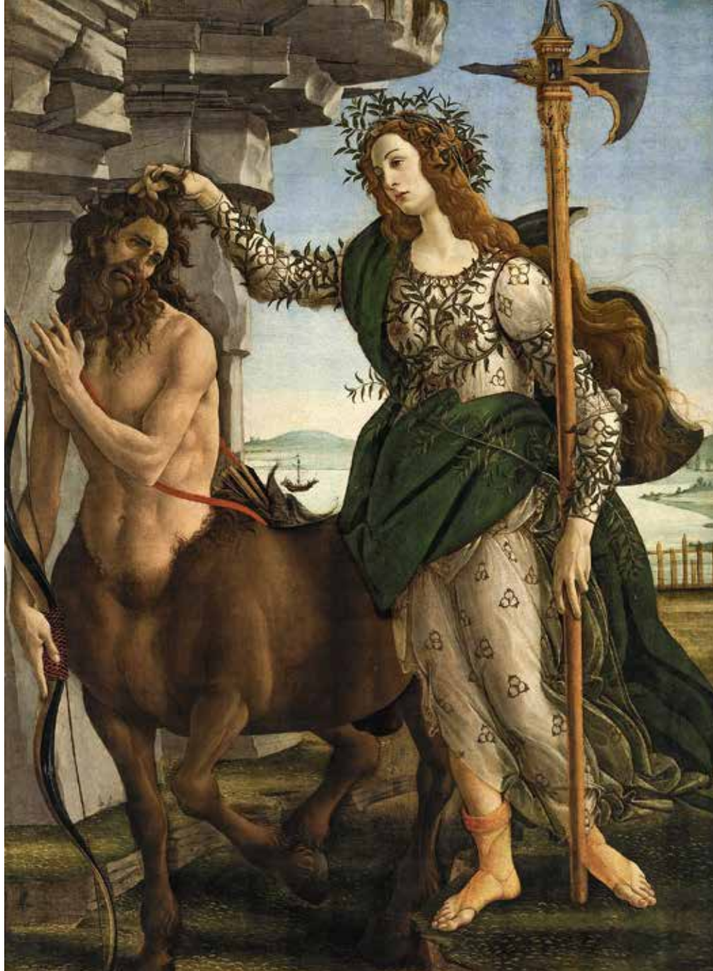
Сандро Боттічеллі. Паллада і Кентавр (фрагмент). 1482 р.

Кентавр знаходиться біля скелі, що нагадує про важкість матерії в найщільнішому її прояві – у формі мінералу; водночас Мінерва зображена у просторі з відкритим небом. Мінерва тримає Кентавра за волосся, тобто за голову, підкреслюючи, що саме розум-мудрість може подолати подвійність людської природи. Подібно до Меркурієвого кадуцея, алебарда Мінерви спрямована вертикально вгору і вказує на небесні сфери, до яких прагне філософ.