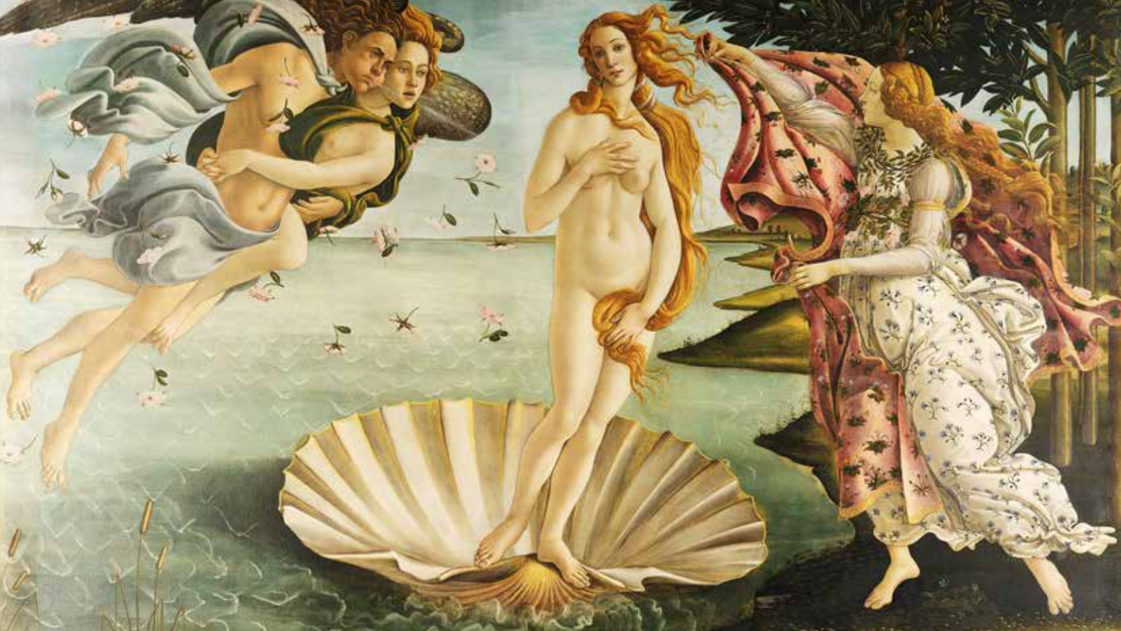
Сандро Боттічеллі. Народження Венери. 1485 р.

народжені їхнім життєдайним диханням, з іншого боку, богиня весни Ора та гірлянда троянд на її сукні – як символ можливості зустрічі Неба і Землі.