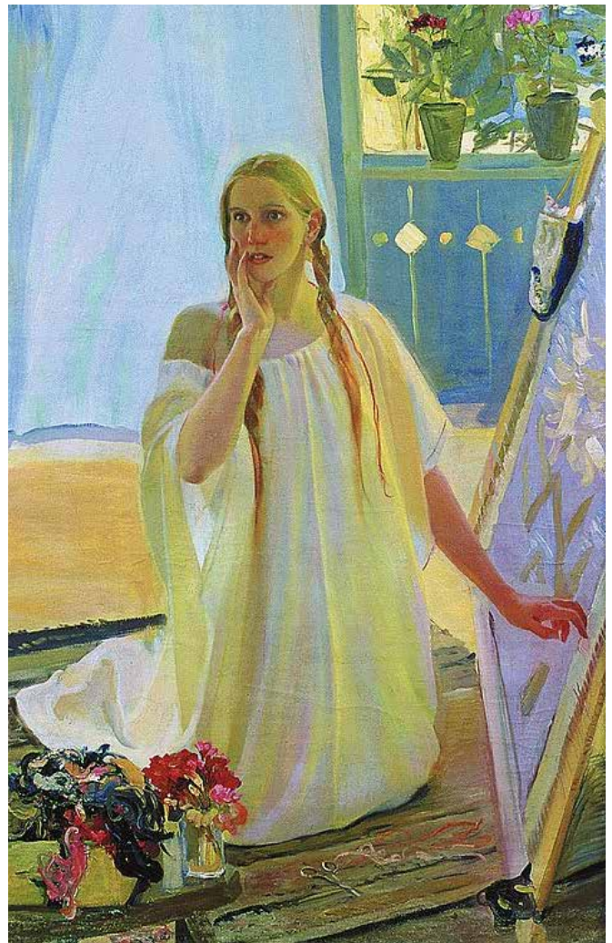
О. Мурашко. Благовіщення (фрагмент). 1909 р.

Усередині кожного з нас є своє небо і ясна сонячна дорога, шлях внутрішньої трансформації.